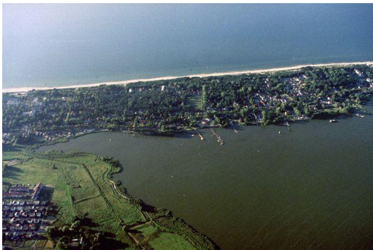
Widok Mielna z lotu ptaka

Położenie, obszar i warunki klimatyczne, charakterystyka wybrzeża morskiego, charakterystyka przyrodnicza, fauna, walory przyrodnicze są szczegółowo określone w opracowaniu ekofizjografii Gminy Mielno z czerwca 2005.