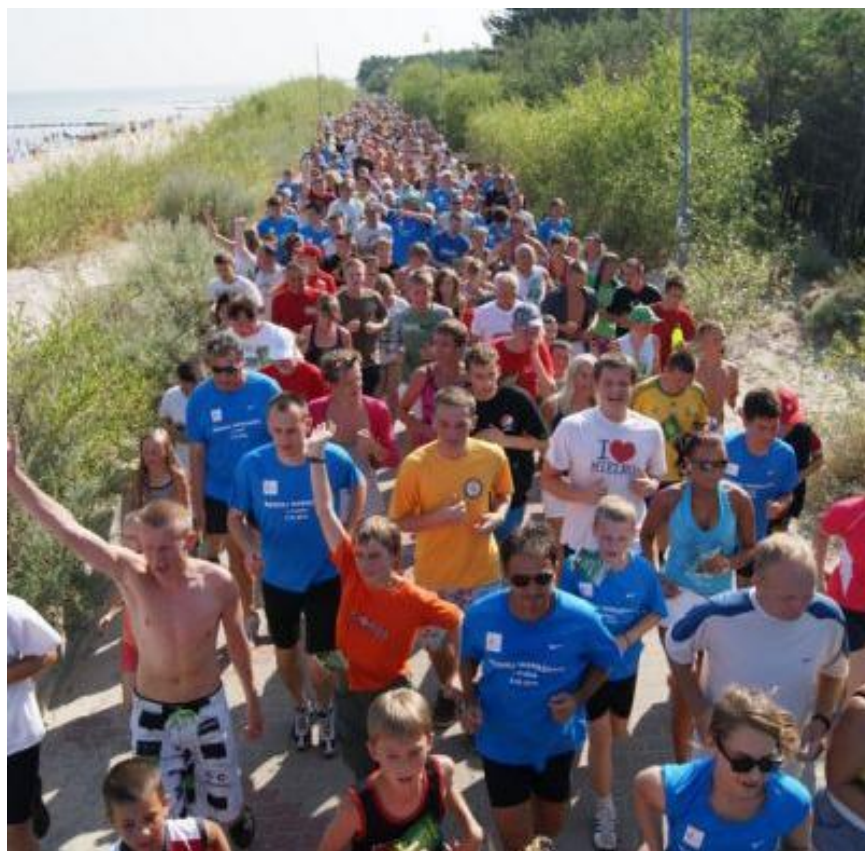
„Bieg śniadaniowy” na promenadzie w Mielnie

Promenada nadmorska jest niewątpliwie jedną z największych atrakcji turystycznych Mielna. Pierwsze odcinki powstały na początku XX w. Promenada była wielokrotnie rozbudowywana na całej długości tzw. „Starego Mielna” i w latach osiemdziesiątych liczyła ok. 1600 m. Obecnie jej długość wynosi w zasadzie ok. 800 m od ul. 1 Maja do ul. Orła Białego. Odcinek pomiędzy ul. Orła Białego i Mickiewicza osunął się podczas sztormów w końcu lat osiemdziesiątych. Końcowa część, od ul. Mickiewicza do ul. Pogodnej w Unieściu, została w ten sposób odcięta od reszty promenady. Centralny odcinek promenady, na wysokości ul. Kościuszki jest miejscem wielu imprez, ze Złotem Morsów na czele. W latach 2009-2010 miejsce to zostało gruntownie przebudowane, powstało nowe zejście na plażę z kładką łącząca dwa odcinki promenady, tarasy widokowe oraz pomnik morsa. Miejsce to stało się odąd nową wizytówką Mielna. Gmina Mielno opracowała wieloetapową dokumentację techniczną odbudowy i modernizacji całej promenady nadmorskiej, jednak kluczowe znaczenie ma odbudowa odcinka łączącego istniejące odcinki, pomiędzy ul. Orła Białego a Mickiewicza.