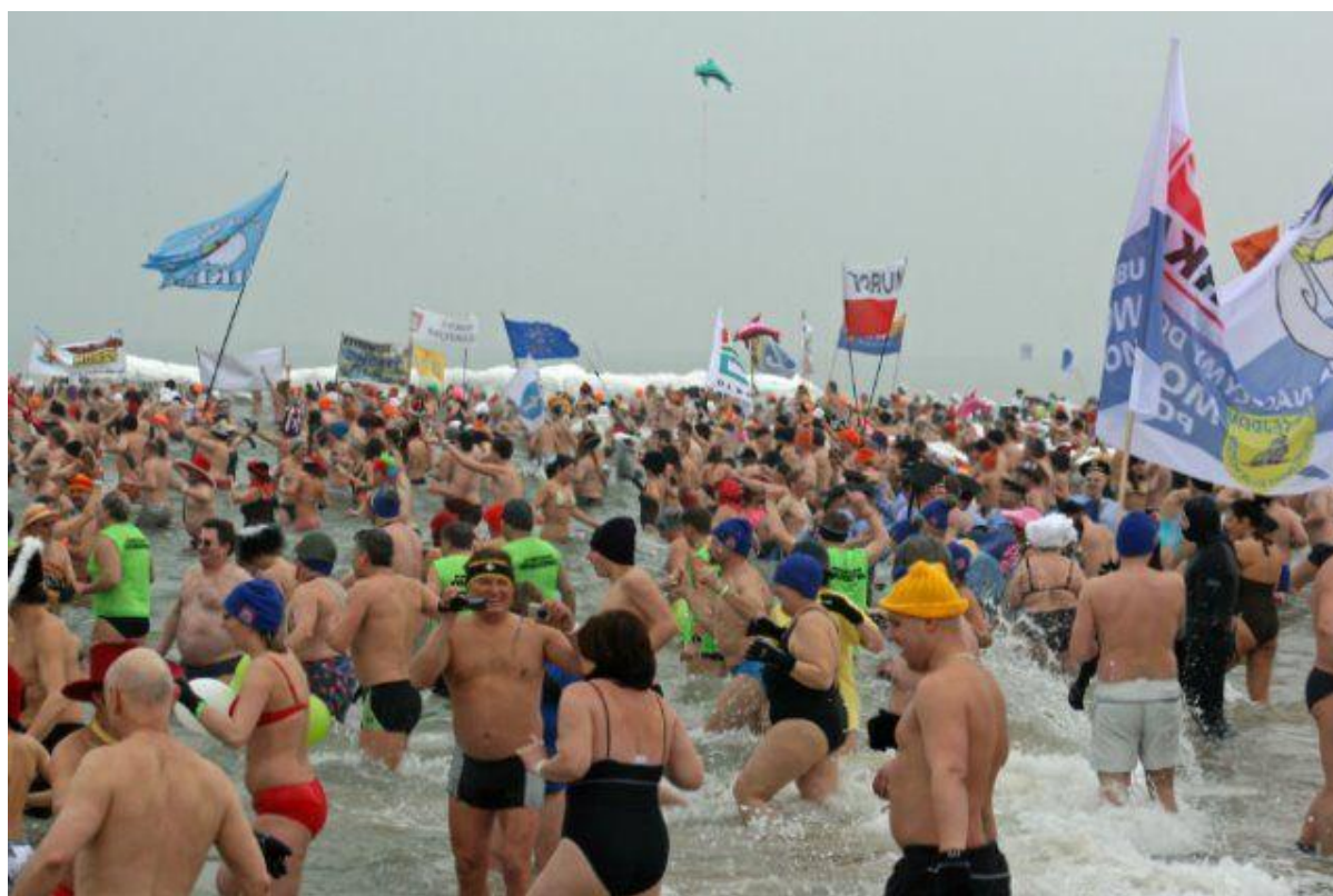
Międzynarodowy Zlot Morsów 2010.

Koszty przedsięwzięcia to ok. 200 tys. zł rocznie. Uwzględniając 7-letnią perspektywę Planu Odnowy Miejscowości (do 2017 r.), przyjmuje się że koszty realizacji przedsięwzięcia w latach 2010-2017 wyniosą ok. 1 400 tys. zł.