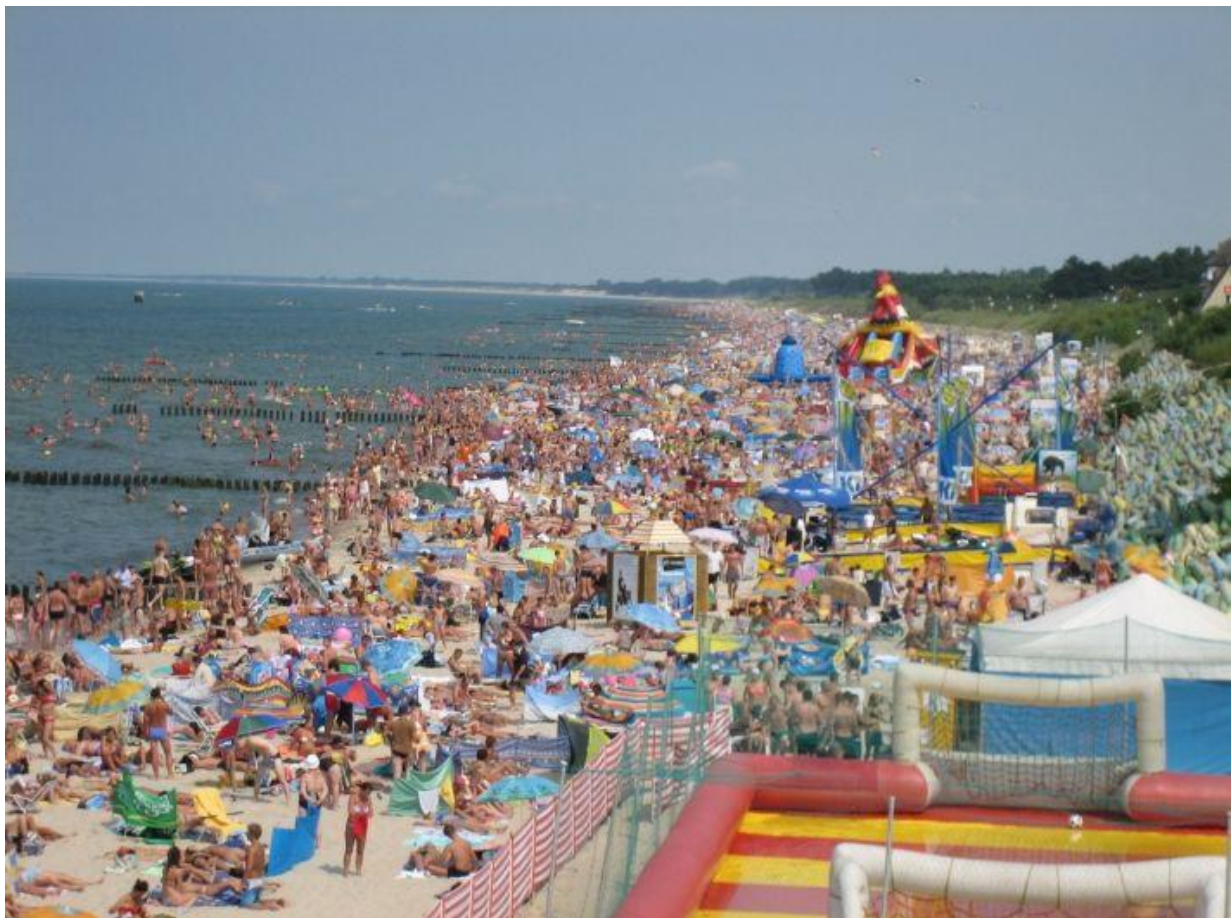
Plaża w Mielnie