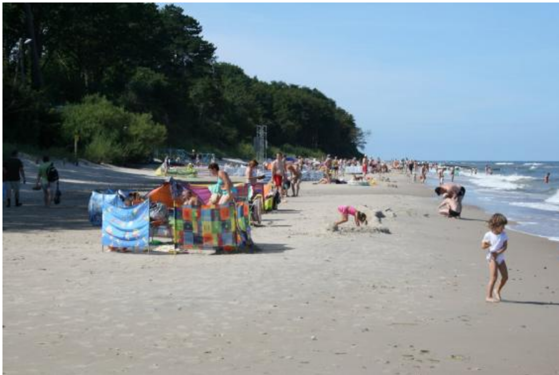
Plaża w Gąskach

Inwestycja wymaga uzgodnień z Urzędem Morskim w Słupsku. Szacunkowy koszt inwestycji: 300 tys. zł.