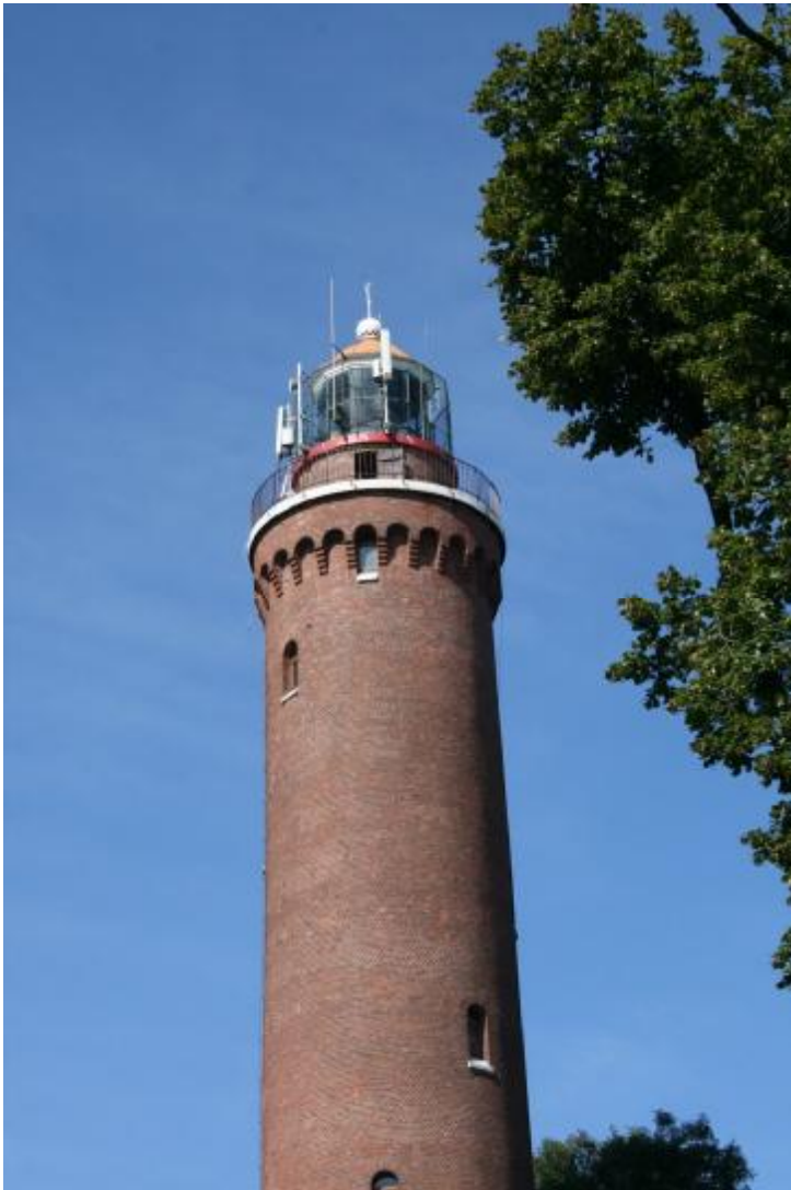
Latarnia morska w Gąskach