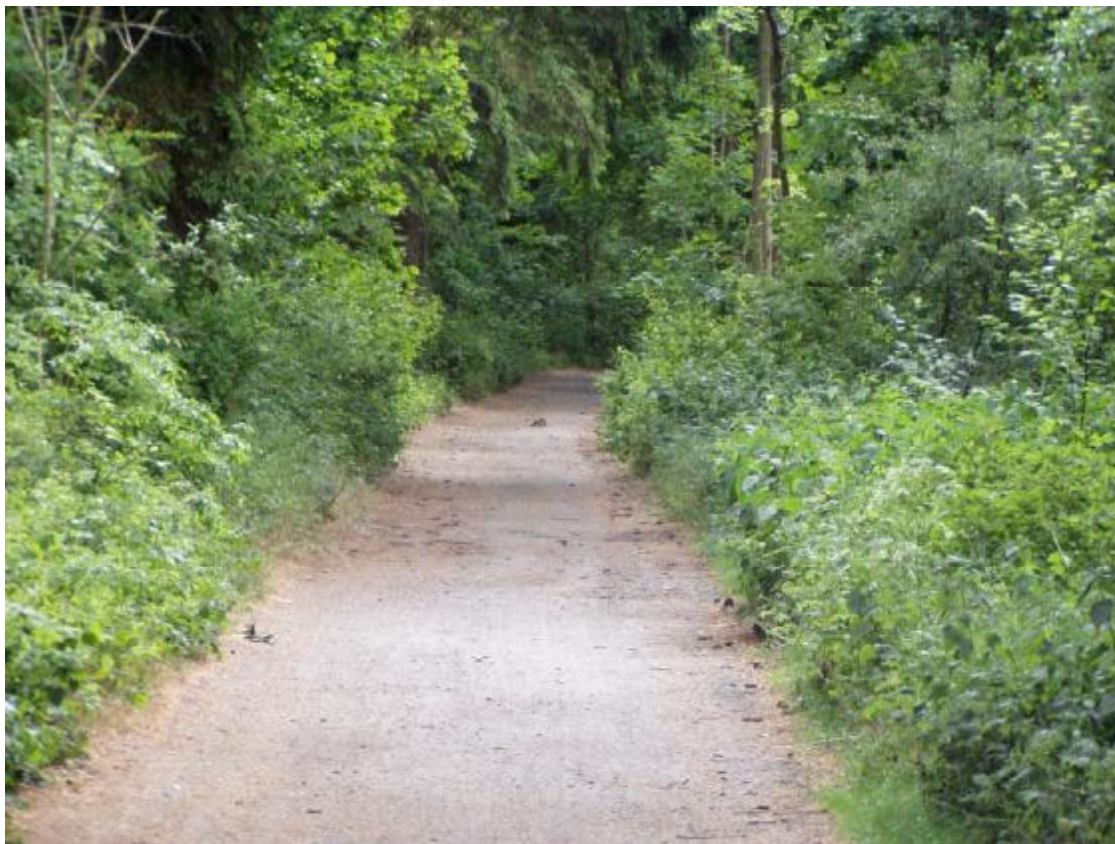
Międzynarodowy nadmorski szlak rowerowy R 10

Ponieważ wykup gruntów jest czasochłonny i wymaga porozumienia z właścicielami zakłada się długi okres realizacji inwestycji; nawet do końca 2015 r. (3-4 lata wykup, 1 rok projekt, 1 rok roboty budowlane). Szacunkowy koszt inwestycji 1 mln zł.