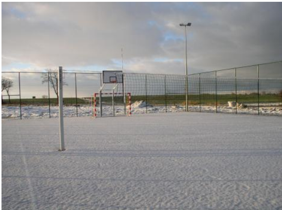
Fragment kompleksu ORLIK 2012 w Gąskach