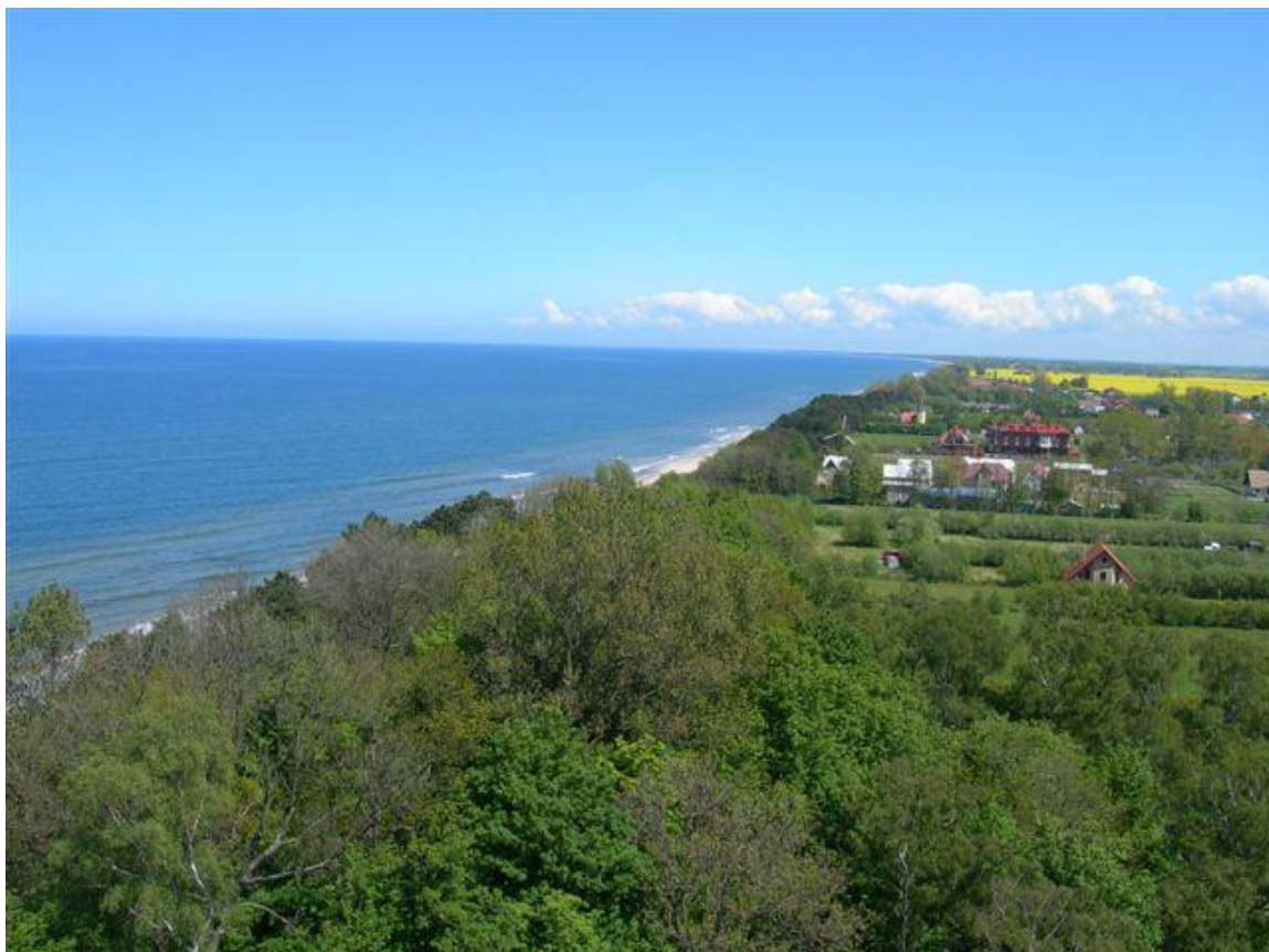
Widok Gąsek z latarni morskiej w kierunku wschodnim.